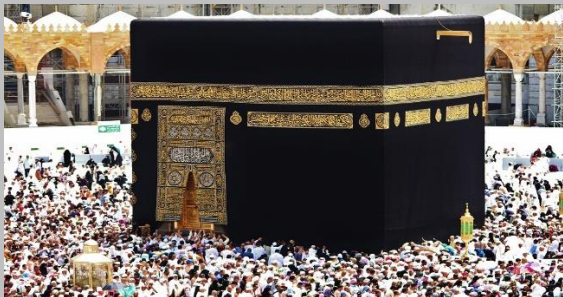
Afbeelding 6: Kaäba.

Ook wetenschap en kunst werden via deze routes verspreid. Er was respect voor de Griekse en de Romeinse wetenschap. De Arabieren vertaalden de boeken uit het Grieks naar het Arabisch. Zo bleef veel kennis uit de Oudheid bewaard.