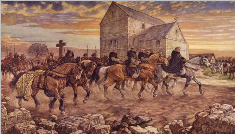
Afbeelding 4: Missionarissen op weg om mensen te bekeren.

Zo kwamen er meer teksten en bleven oude teksten bewaard.